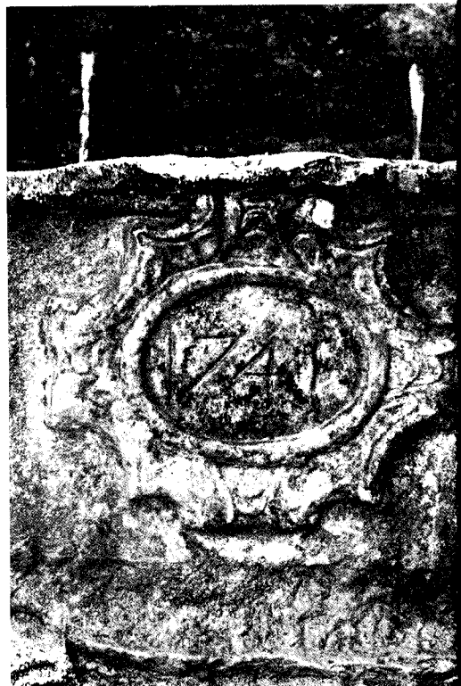
La font (1741): detall.