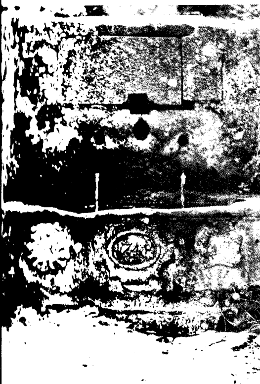
La font (1741) detall.