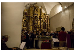
Assaig a St.Cebrià