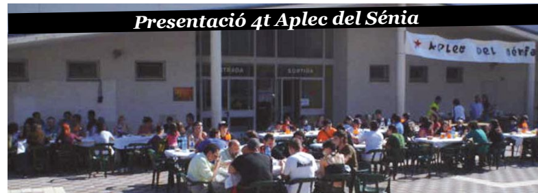
Presentació 4t Aplec del Sénia