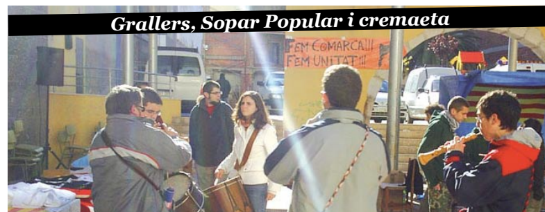
Grallers, Sopar Popular i cremaeta

C omençarem presentant l'aplec2008 al Casal Jove. Explicarem les activitats previstes i farem un repàs del projecte pel qual va nàixer l'Aplec del Sénia: la Comarca del Sénia. Un projecte que pretén unir i enfortir les relacions entre els pobles situats a banda i banda del Riu Sénia que, lluny d'ésser frontera és realment un nexce.